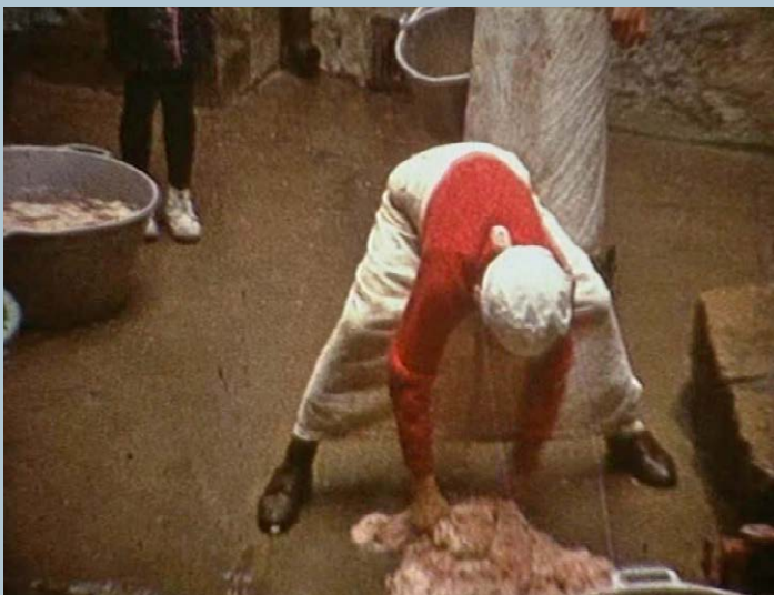
Nettoyage boyaux andouillettes - 1966